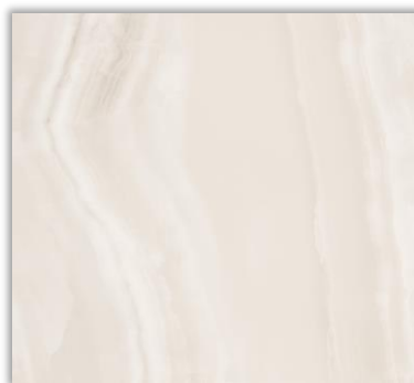
indicação de uso: